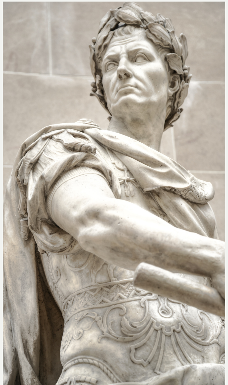
César (1722) par Nicolas COUSTOU - Marbre Musée du Louvre, Paris

Parmi les codes les plus anciens, on trouve le code César. Il était utilisé par l'empereur romain Jules César pour communiquer avec ses armées. Le principe est simple : on décale les lettres de l'alphabet de trois rangs. Ainsi, A devient D, B devient E, C devient F, etc. Par exemple « MXOHV FHVDU » signifie « JULES CÉSAR » !