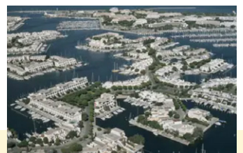
Port-Camargue, Gard