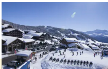
Les Saisies, Savoie