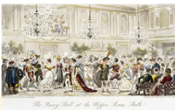
Bal masqué à Bath, Angleterre