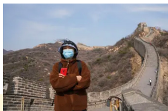
Grande Muraille de Chine, 2020